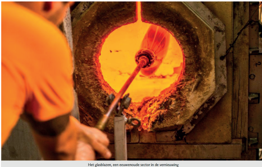
Het glasblazen, een eeuwenoude sector in de vernieuwing