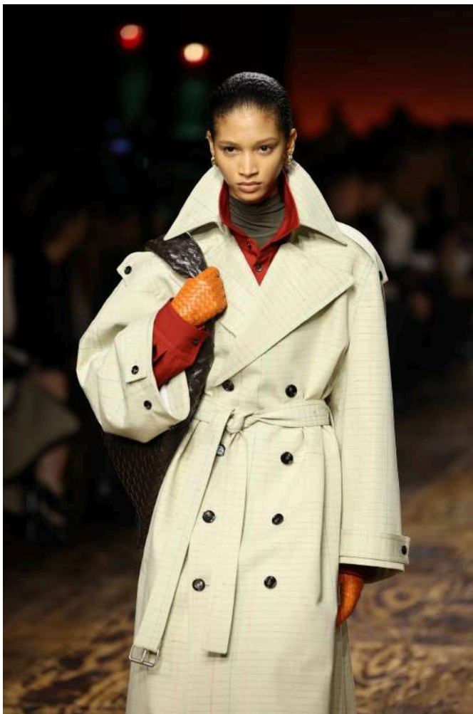
Bottega Veneta autunno inverno 2024 2025

La semplicità estetica corrisponde a un'estrema complessità strutturale, ispirata dall'iconico pre-Intrecciato di Bottega Veneta e nata grazie a un savoir faire artigianale che pochi altri possono vantare. Tra stampe che richiamano i timbri sui passaporti e trench come quaderni a quadretti su cui scrivere, giochi ottici, fiamme e frange taglianti, il lusso diventa utilitario e l'eleganza si fa concreta, senza perdere quei vezzi di eccentricità che sanno trasportarci altrove. E sanno portarci a sperare che anche se tutto brucia intorno a noi, la bellezza salverà il mondo.