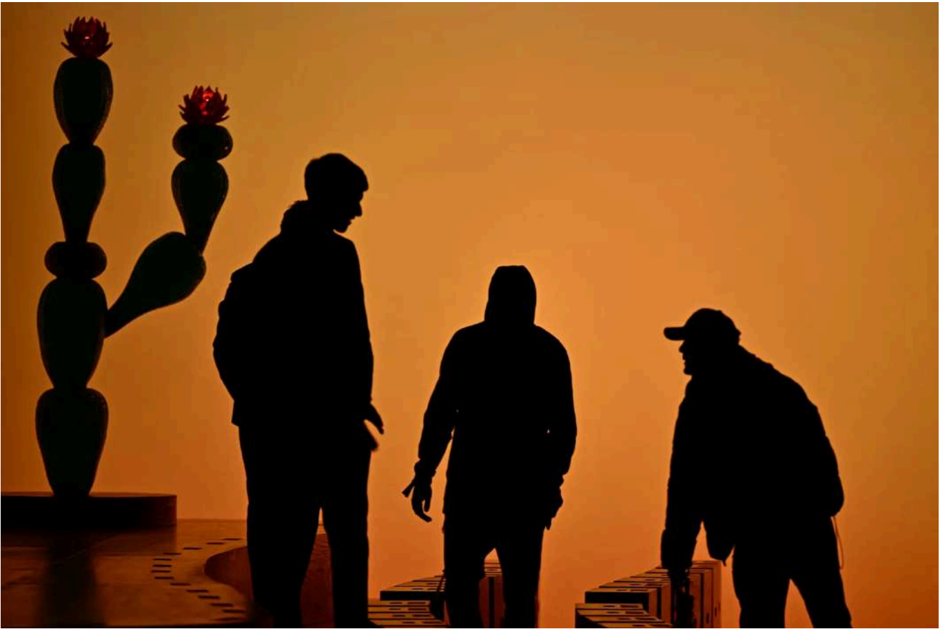
Bottega Veneta autunno inverno 2024 2025