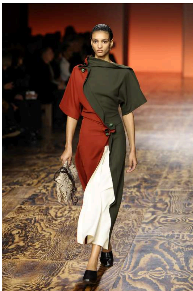
Bottega Veneta autunno inverno 2024 2025