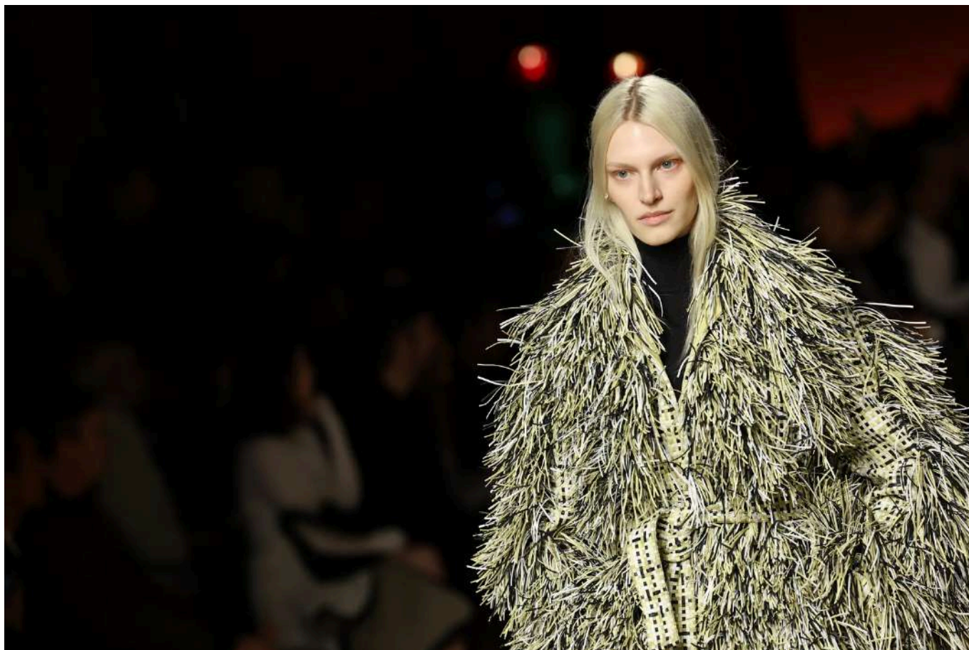
Bottega Veneta autunno inverno 2024 2025