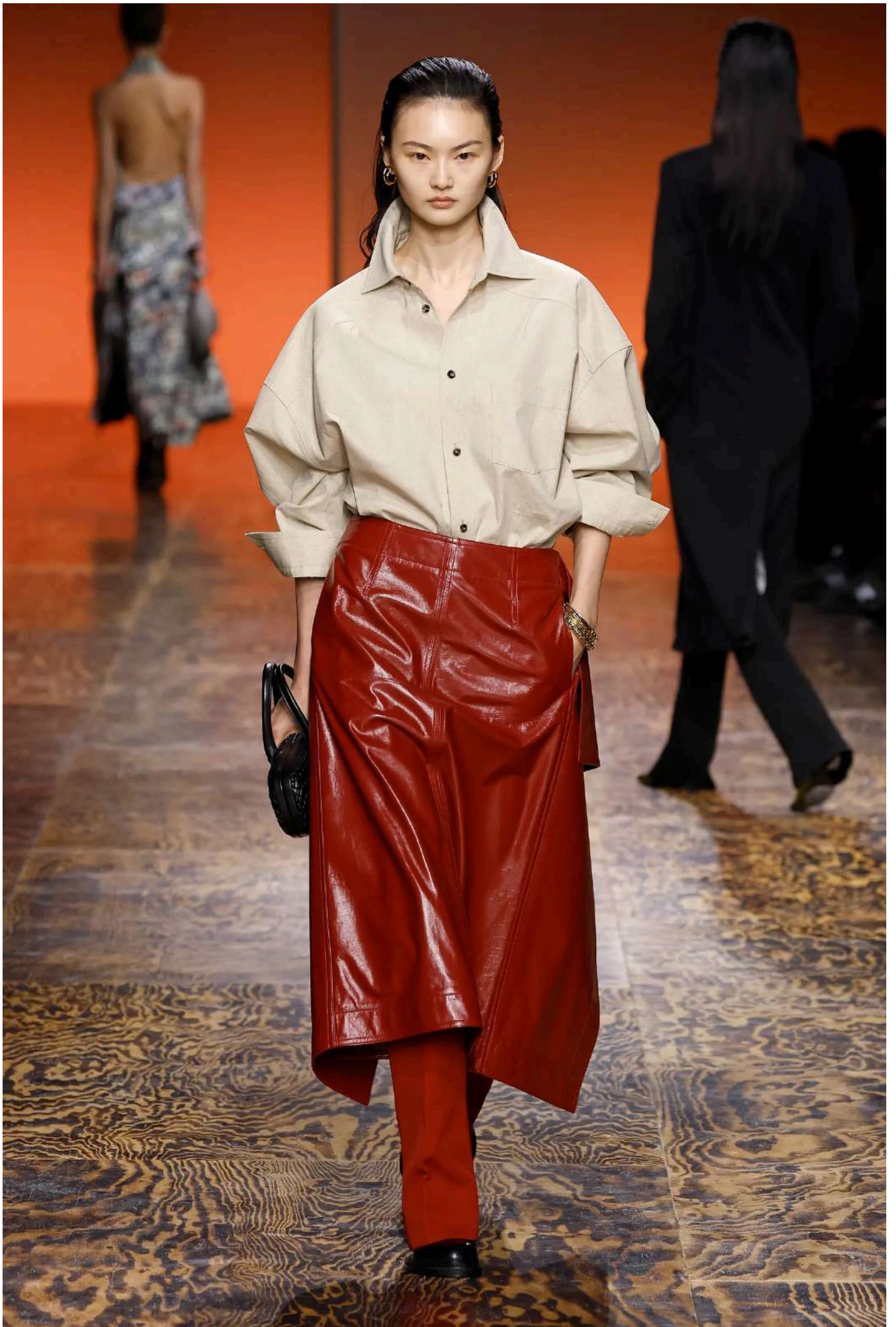
Bottega Veneta autunno inverno 2024 2025