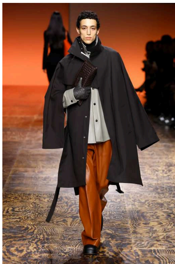
Bottega Veneta autunno inverno 2024 2025