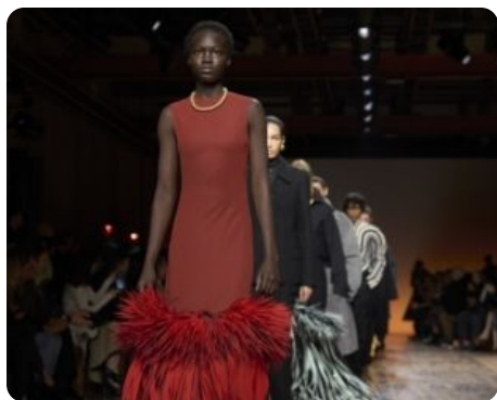
BOTTEGA VENETA F/W24 25 Febbraio 2024