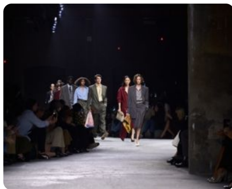
BOTTEGA VENETA SS2025